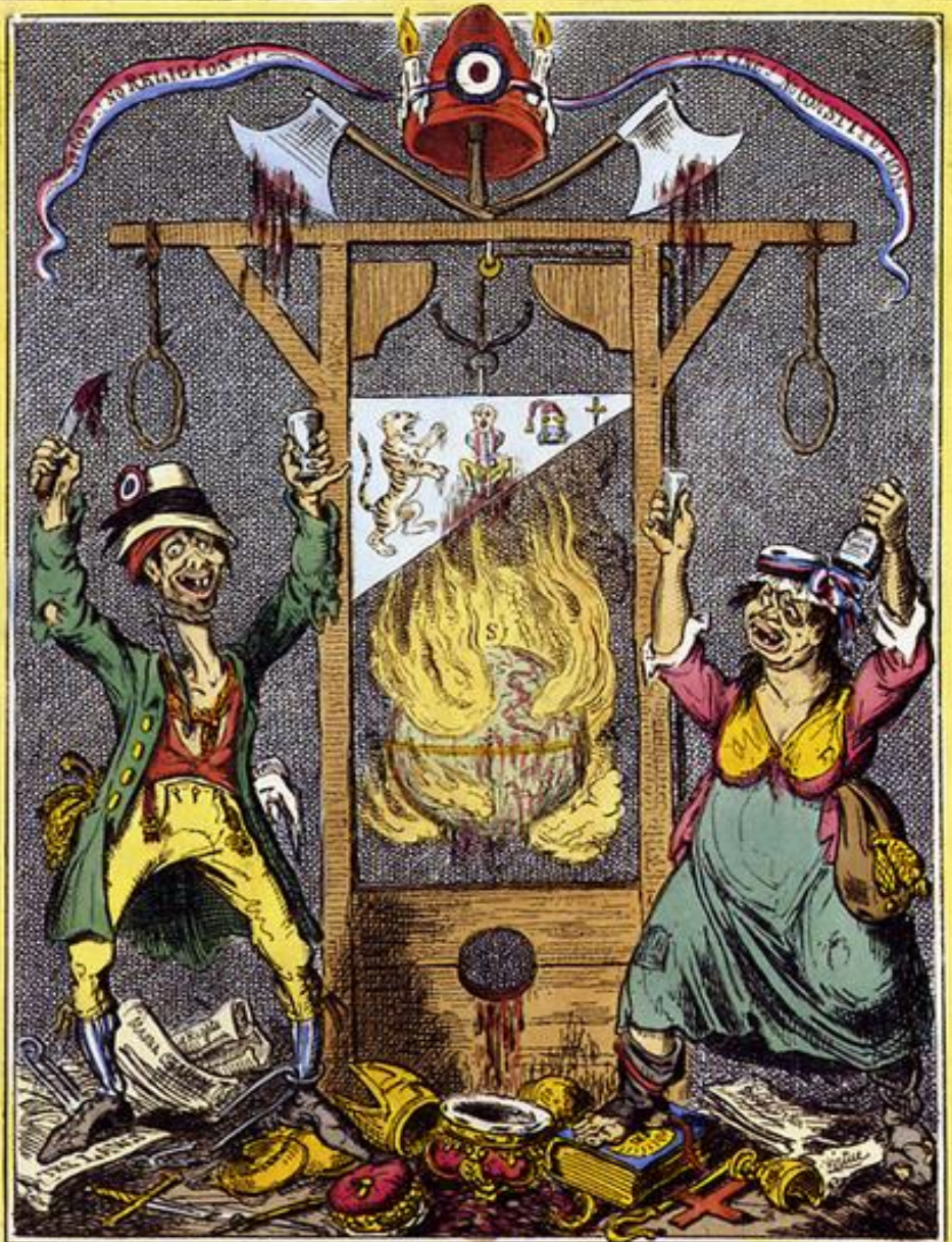
The Radical's Arms.