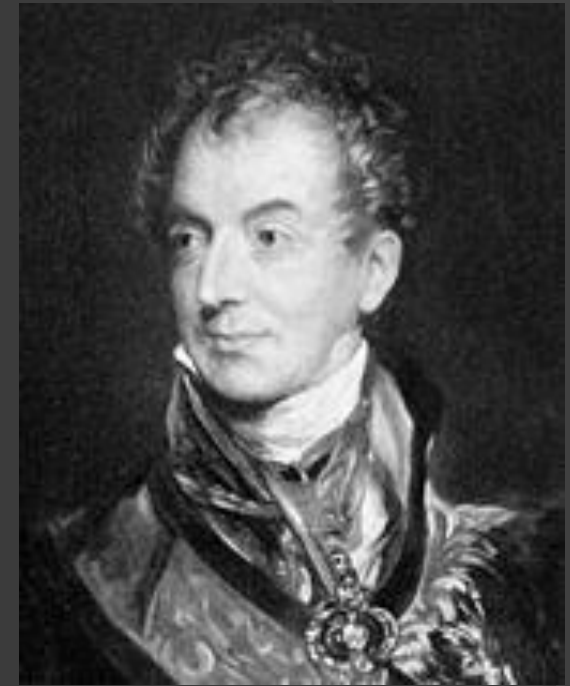
Vysvětlovací tabulka k obrazu »Videňský kongres«.