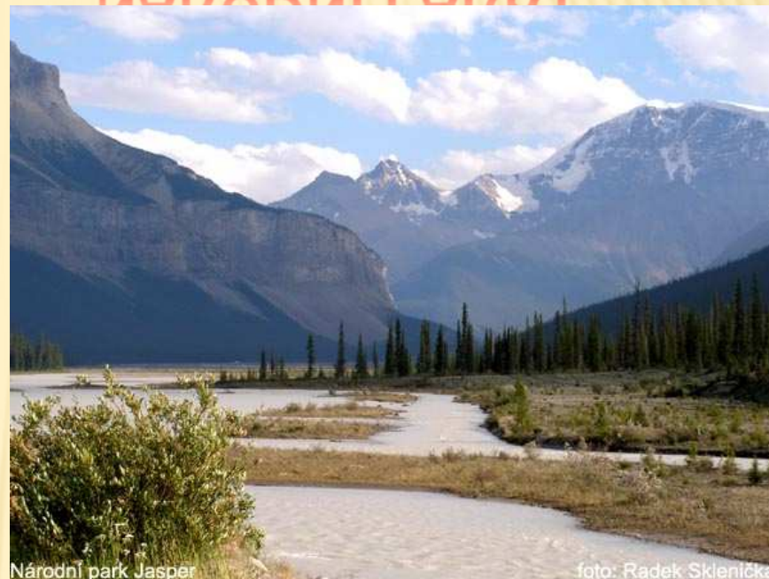
Národní park Jasper