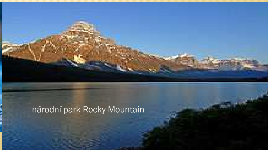
národní park Rocky Mountain